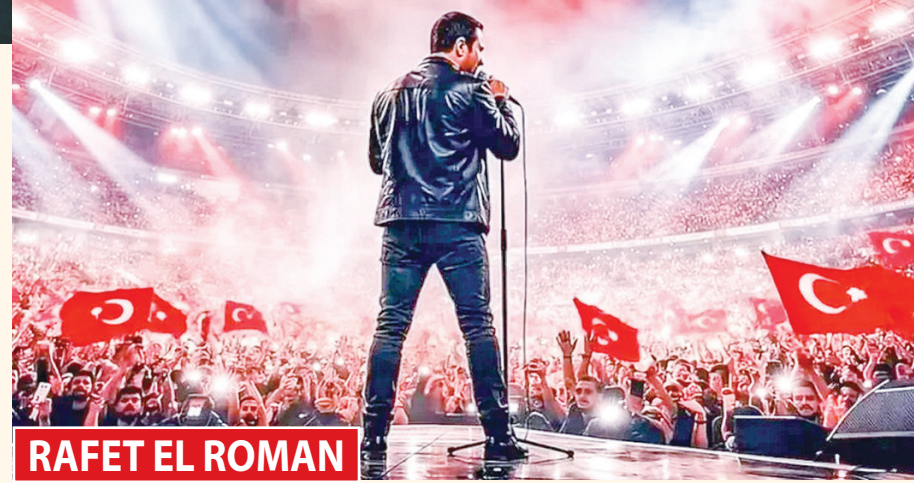
RAFET EL ROMAN